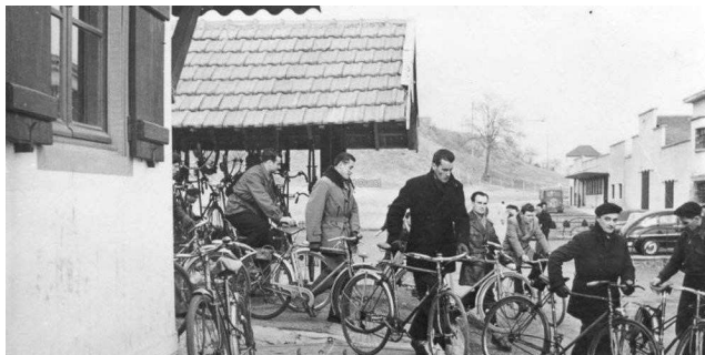
Sortie d'usine à vélo 1939.

Il est urgent de sortir de toutes ces mauvaises habitudes !! A défaut de s'intéresser à son collègue, ne le dénigrez pas !! L'individualisme est une des grandes maladies de notre temps, faites un effort, et ensemble retrouvons une partie de ce qui faisait au temps jadis ce bel esprit collectif qui a toujours habité notre usine de Bidos.